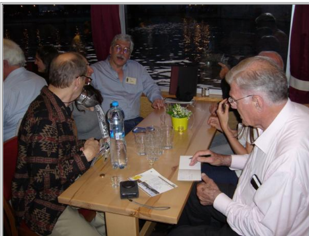
Fig. 12 - Cena sulla Moldava.

... e nel bellissimo Hotel Grandior, sede del congresso (fig. 13).