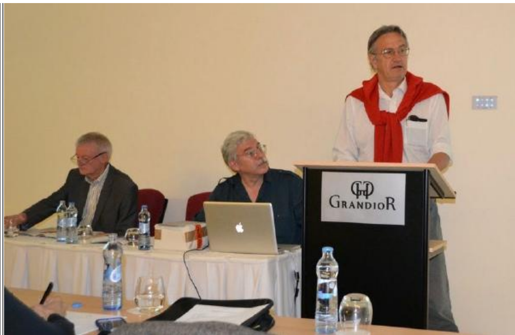
Fig. 5 - Lo speech di Nicholas Lanier, osservato da Wiltshire e Gallegos.

Thomas Thomsen: “Metal Chess Sets other than Cast Iron Sets” .