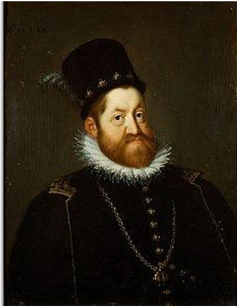
Fig. 7 - Rodolfo II di Asburgo.

Non è mancato il tradizionale chess market , dove i soci si scambiano set, libri e altri oggetti attinenti alla loro passione ( fig. 8 ).