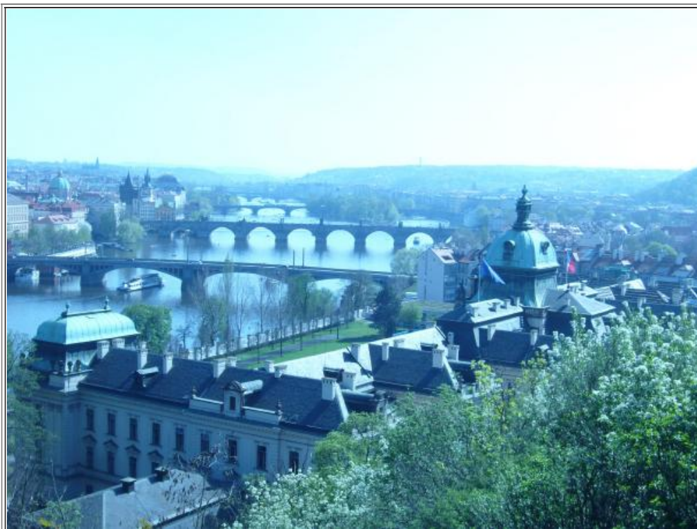
Fig. 14 - Un panorama di Praga visto dal castello.

Tutti comunque hanno riportato un bellissimo ricordo della “città d’oro” (fig. 14).