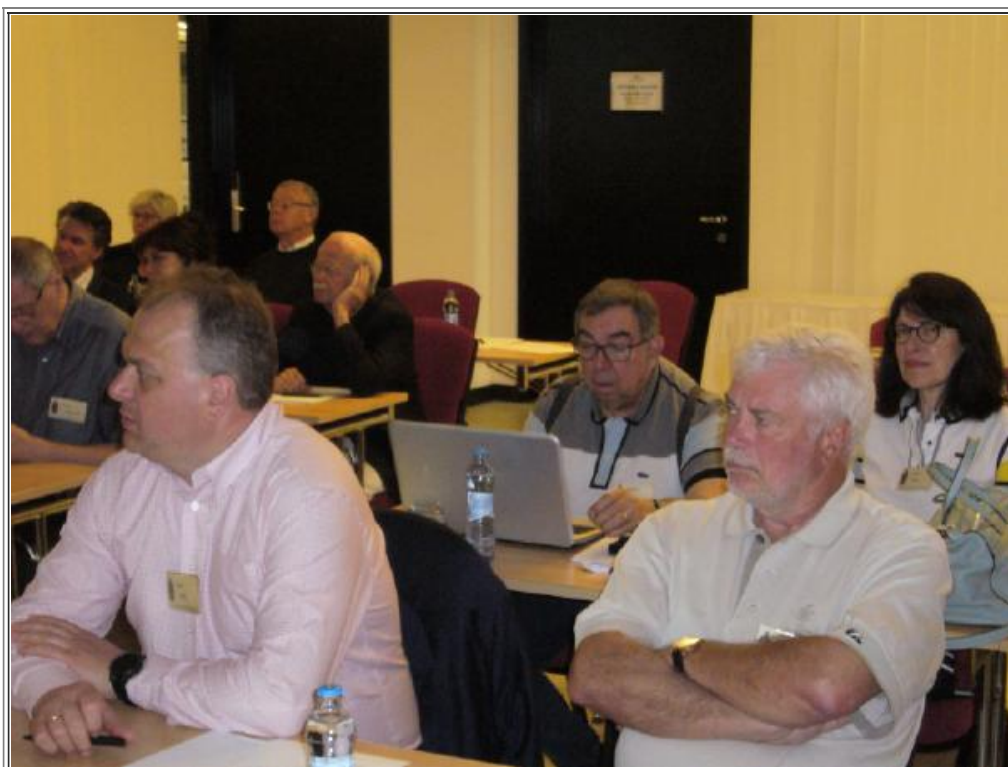
Fig. 2 - Un momento del seminario.

Sternberg e il Museo di Arti Decorative con esibizione di scacchi. I soci hanno presentato interessanti relazioni (fig. 2).