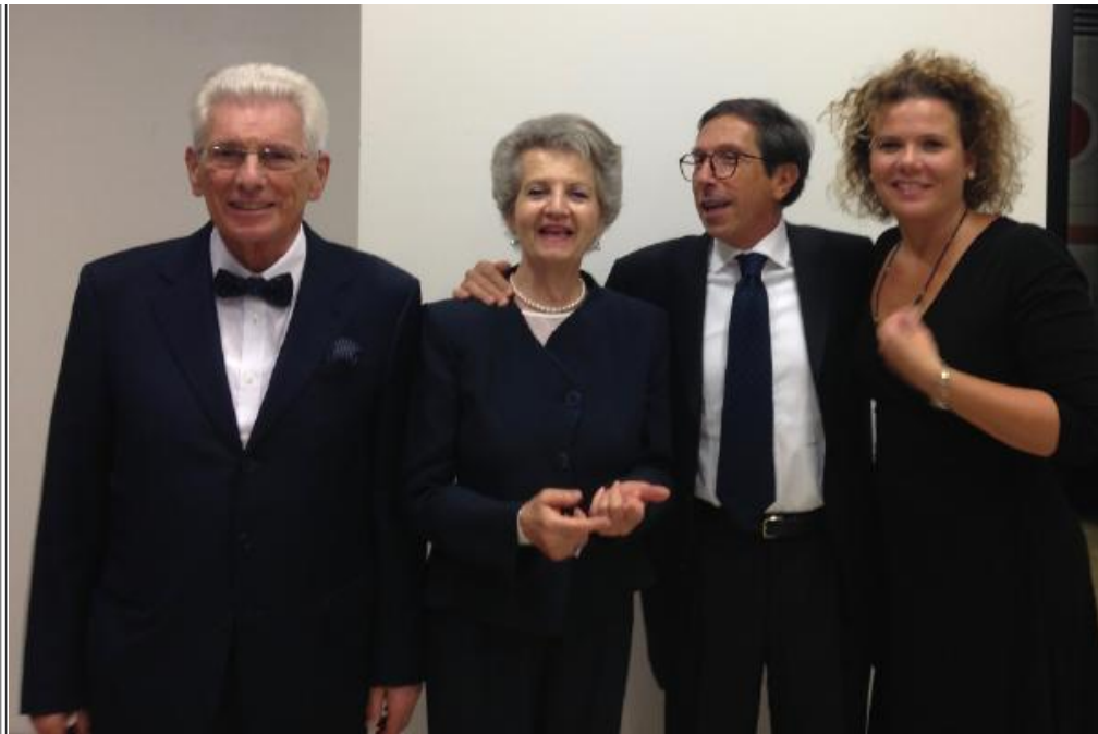
Fig. 13 - Gli italiani al gala dinner .

Tutti comunque hanno riportato un bellissimo ricordo della “città d’oro” (fig. 14).