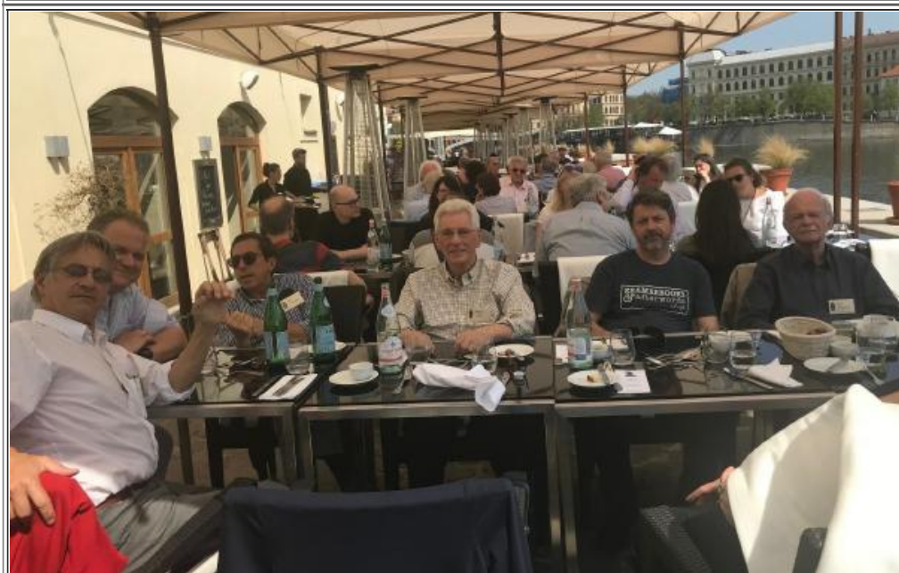
Fig. 9 e 10- Due immagini di un pranzo in riva al fiume.