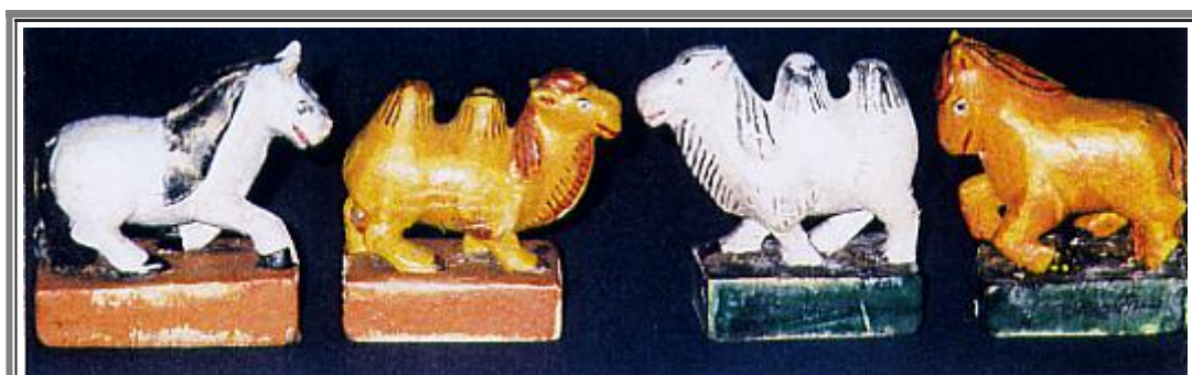
Fig. 3 - b, c: gli Alfieri-cammelli ( Temee ); a, d: i Cavalli ( Mori ).