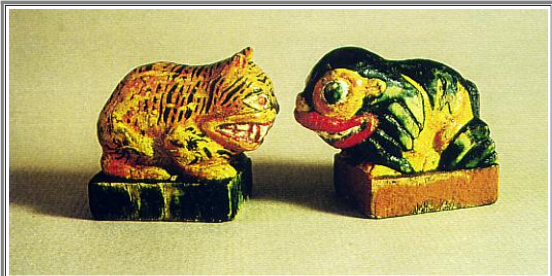
Fig. 7 a, b - Le Donne ( Bers ): tigre maligna e leone sacro buddista.