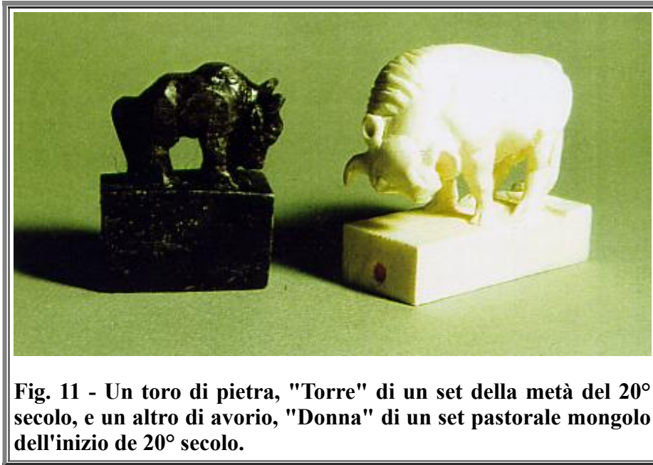
Fig. 11 - Un toro di pietra, "Torre" di un set della metà del 20° secolo, e un altro di avorio, "Donna" di un set pastorale mongolo dell'inizio de 20° secolo.

di un gioco in pietra della metà del 20° secolo).