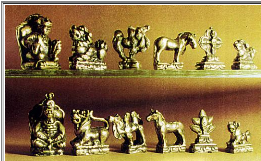
Fig. 12 a, b - Un set metallico che oppone un partito aggressivo (in alto, riconoscibile dal Noyion con un ginocchio sollevato) a uno pacifico (in basso, col Noyion che tiene le gambe incrociate alla turca).

gengiskhanide aggressivo (fig. 13 a) e un khan nomade pacifico (fig. 13 b).