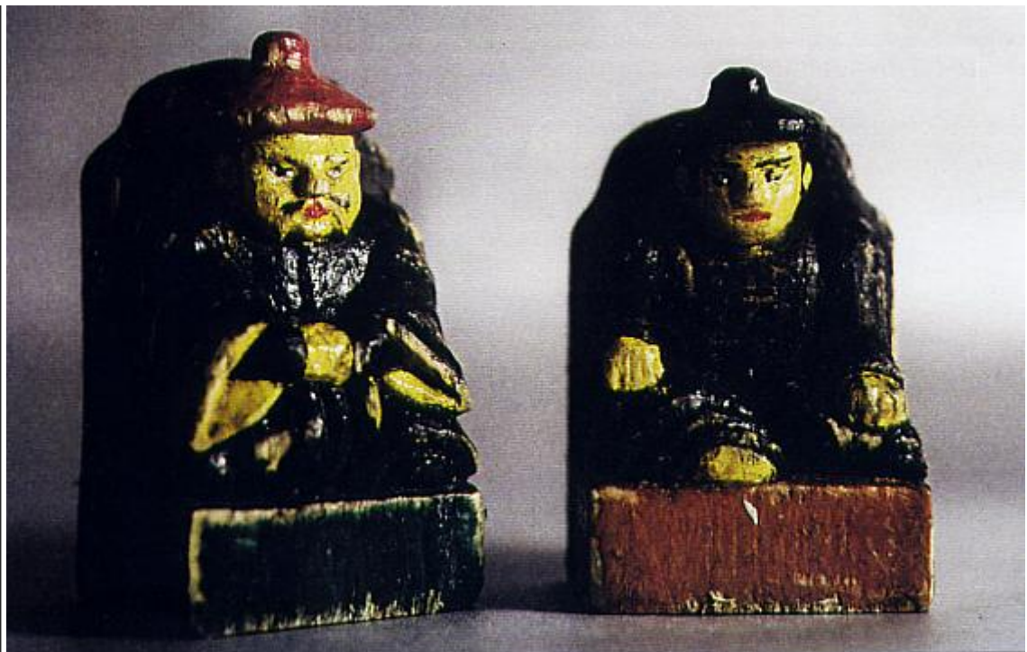
Fig. 2 - I due Re ( Noyion ), anziano e giovane.