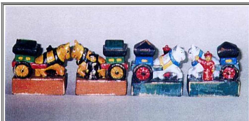
Fig. 4 - Le Torri-carrozze ( Terghe ).