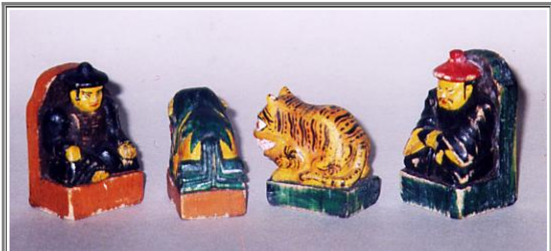
Fig. 8 - Re e Donne: si nota la coda del leone che scende divisa in sei parti.

A priori, nessun giocatore occidentale immaginerebbe il perché della metamorfosi, ma in realtà questa figura non deriva dalla Donna europea, bensì dal Consigliere o Generale indiano, o dal Visir persiano. Orbeli e Trever nel 1936 (citati in Montell 1939, p. 98) hanno affermato che i Mongoli, non pronunciando la lettera "effe", hanno trasformato le parole persiane firz , frazin , farzin , fers o vizir in Bers , cioè tigre, e di conseguenza, nel lato opposto, per il ruolo corrispondente è stato scelto il leone (nella fig. 9, tra i loro Re, si vedono le Donne, leone e tigre, di un gioco di legno del 1950). La stessa teoria è stata accettata da Montell (1939), Camman ('46), Montagu ('58), Linder ('94) e Ivanova ('97).