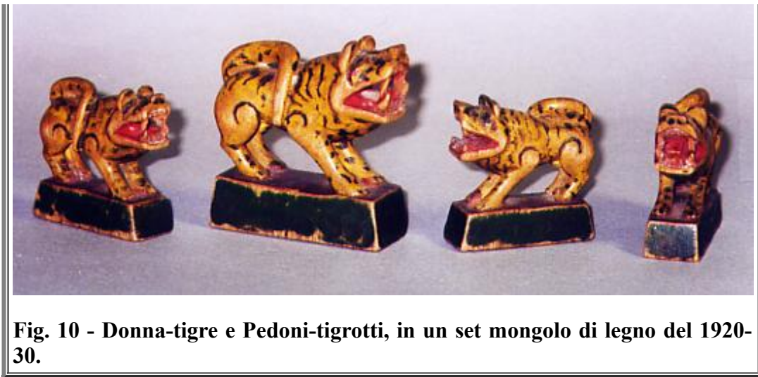
Fig. 10 - Donna-tigre e Pedoni-tigrotti, in un set mongolo di legno del 1920-30.