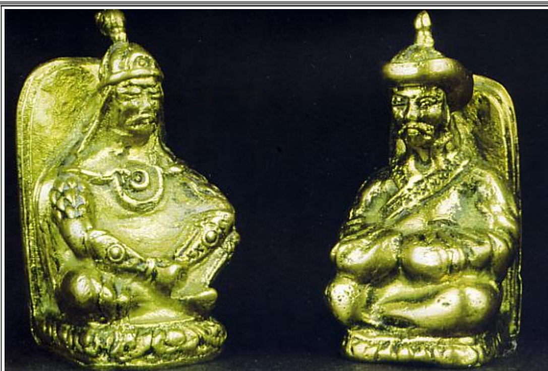
Fig. 13 a, b - I due Noyion di un altro set metallico: un guerriero gengiskhanide (aggressivo, col ginocchio sollevato) e un khan nomade (pacifico, seduto alla turca).