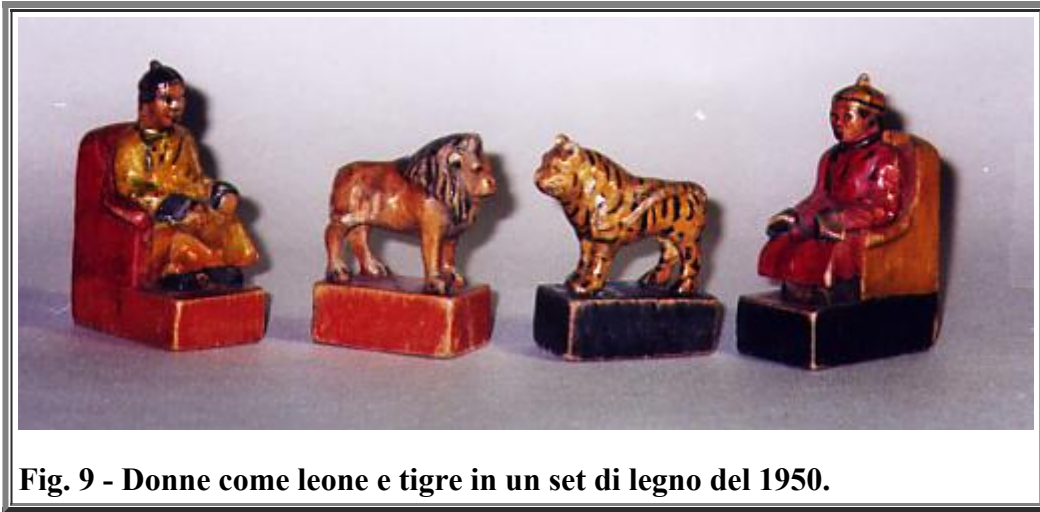
Fig. 9 - Donne come leone e tigre in un set di legno del 1950.

A mio parere però non può essere solo un cambio di consonante a far diventare il visir ( fers ) una belva ( bers ): il visir, o il generale, nelle battaglie costituisce il braccio operativo del Re e ne rappresenta la forza e le virtù, e nella tradizione mongola la forza e la tenacia sono espresse dal leone o dalla tigre.